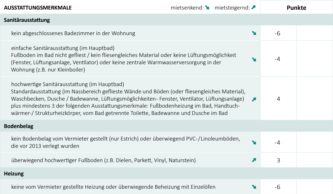
Tabelle 2: Punktwerte für Wohnwertmerkmale, die den Mietpreis beeinflussen

Bitte achten Sie darauf, dass nur von Vermieterinnen / Vermietern gestellte Ausstattungselemente für die Ermittlung der Gesamtpunktzahl berücksichtigt werden können. Die in der Tabelle 2 aufgeführten Modernisierungsmaßnahmen können teilweise nur für Wohnungen bis zu einem bestimmten Baujahr berücksichtigt werden, da es sich um „nachträgliche“ Modernisierungsmaßnahmen handelt. Die Modernität / der gute Erhaltungszustand der Ausstattung von Wohnungen mit jüngerem Baualter kommt in einem höheren Basispreis in Tabelle 1 zum Ausdruck.